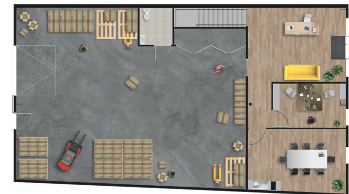
Exemple d'aménagement de cellule