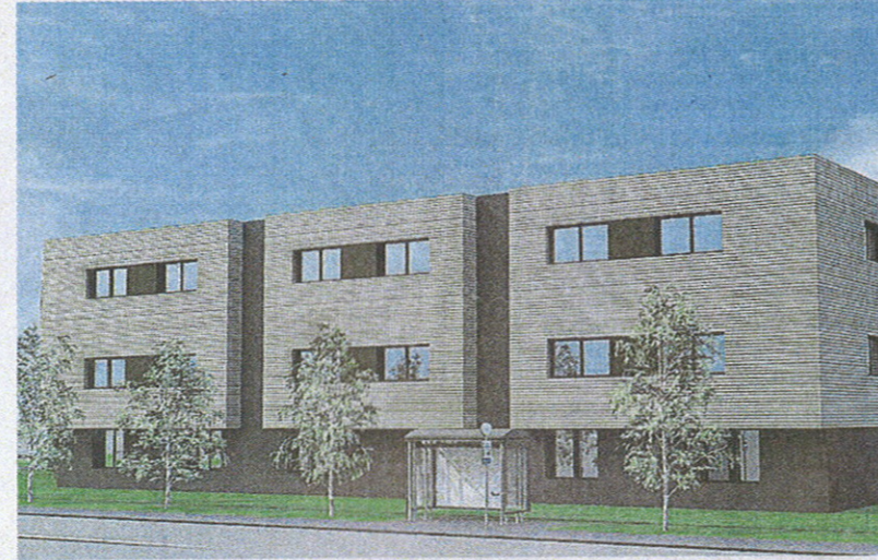
2 600 m 2 de bureaux sortiront de terre au printemps 2013, rue de la Hunaudaye. Le bâtiment, à l'architecture moderne, est un mixte de béton et de bois.